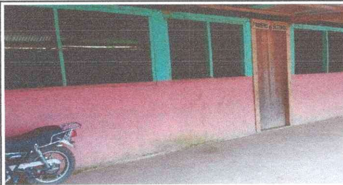
Foto 3: Sustitución de ventanas de malla a metal y vidrio modulo 1