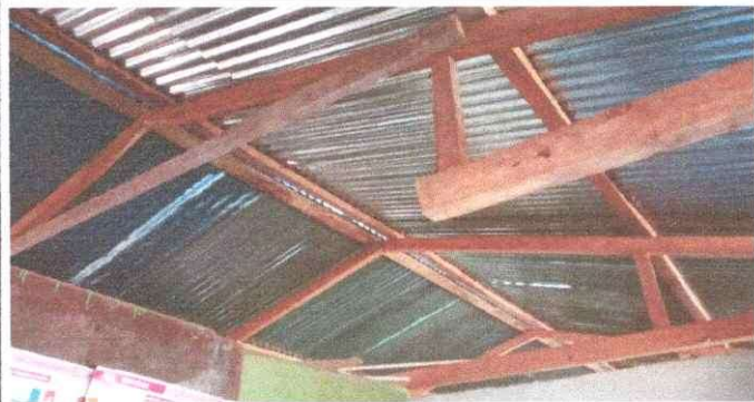
Foto1: Sustitución de costanera por deterioro